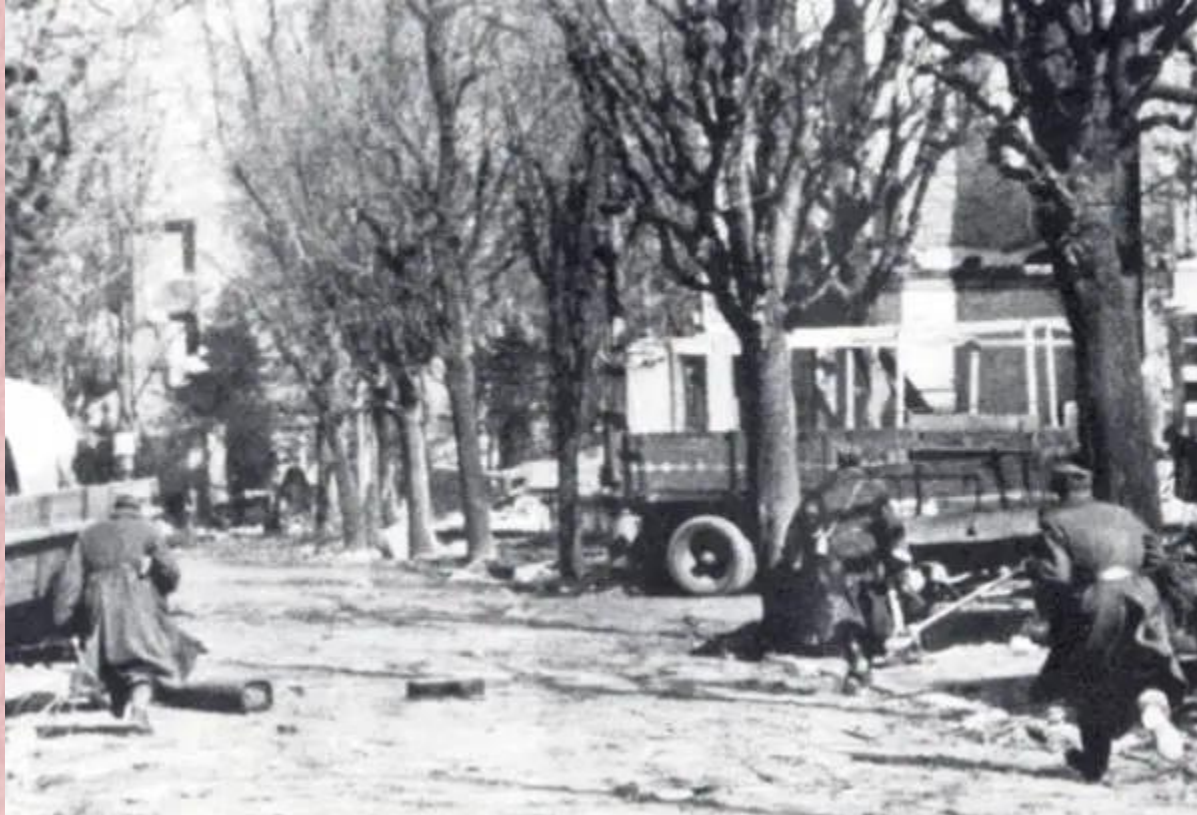
Generalny szturm z 17 na 18 marca 1945r.