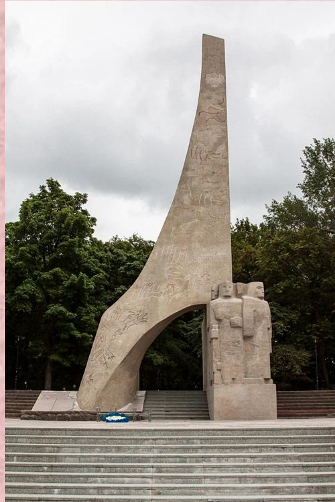
Pomnik Zaślubin Polski z morzem w Kołobrzegu